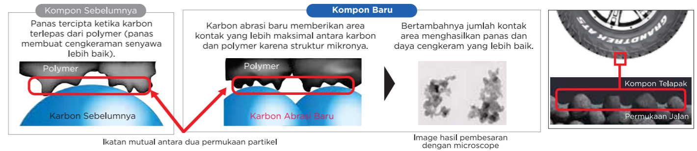
Ikatan mutual antara dua permukaan partikel